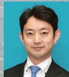
千葉市長 熊谷 俊人