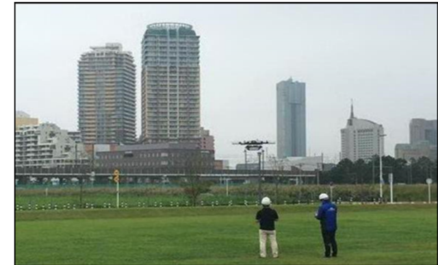
※国家戦略特区制度を活用したドローン宅配等実証実験の様子