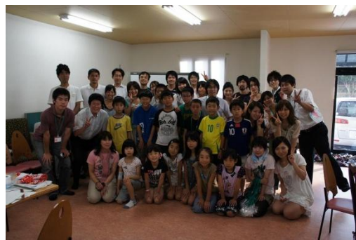
最後にみんなで記念撮影。 3日間おつかれさまでした！！