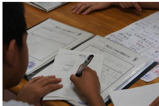
事業の実績を計算します。 うまく黒字を出すことができたかな？

この経験を大人になった時に活かして、アントレプレナーシップ（起業家精神）を持った人材となることを願っています。