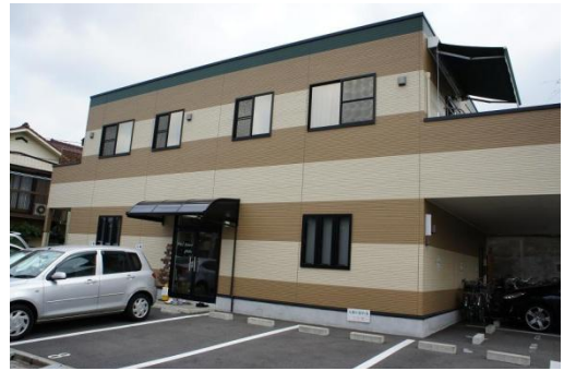
3日目は千葉大学近くのPBLスクールで準備を行います。

西千葉子ども起業塾は残業禁止なので、前日に準備が終わらなかった会社は、11時半の第三土曜日スタートまでに、準備を進めます。