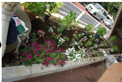
なんということでしょう。さびしかった花壇も、たくさんの方の協力でこんなににぎやかになりました。