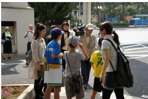
テレビ局も取材に来ました。