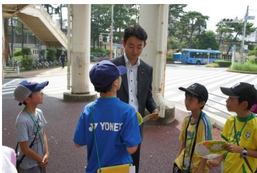
市長にウチワを渡して、会場に案内します。