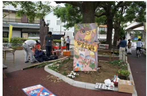
フクロウ広場も準備中。大きなフクロウの看板がお出迎え。

清掃及び花を植える会社は、準備の清掃を手伝うことを事業の内容にしていたので、早速清掃をお手伝いしています。