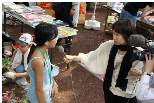
インタビューも受けました。 レポーターのお姉さんも真剣な表情です。