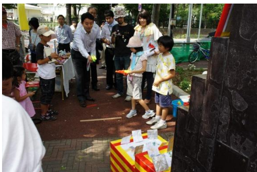
水鉄砲の射的に挑戦。かなり難しかったようです。