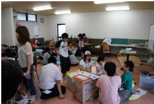
準備は第三土曜日直前まで続きます。間に合うか？