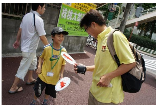
うちわ会社は道行く人達に広告入りのうちわを配 って、第三土曜市をPR。たくさんの人を集めよ う！