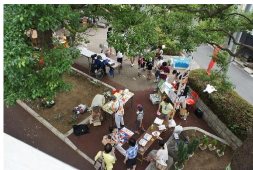
第三土曜日にはいろいろな人が参加します。 どんどん盛り上げていこう！