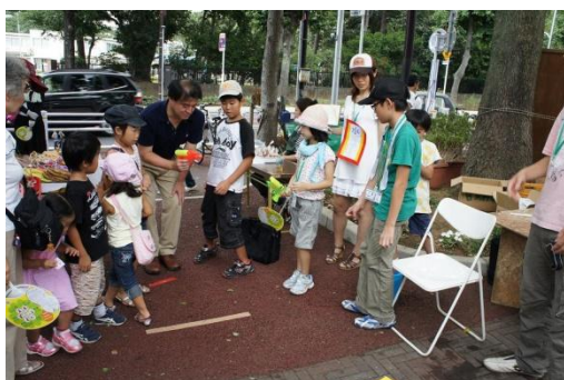
打ち水会社では、お客さんに水鉄砲で射的を楽し んでもらい、打ち水の効果で会場を涼しくするこ とを狙いました。