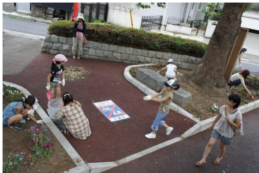
フクロウ広場の清掃をお手伝い。市の前に広場をきれいにしてお客さんが入りやすい雰囲気を作ります。