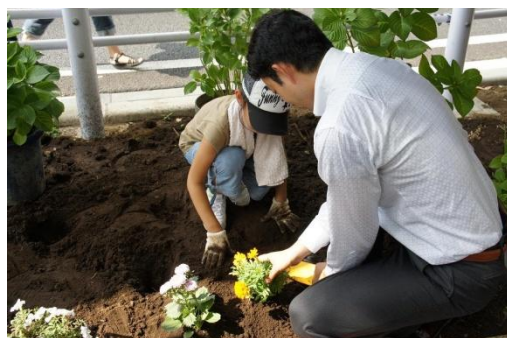
市長にも花を植えてもらいました。