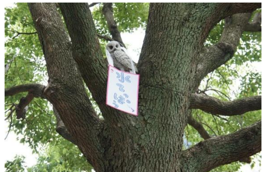
木の上のフクロウもイベントのPR。