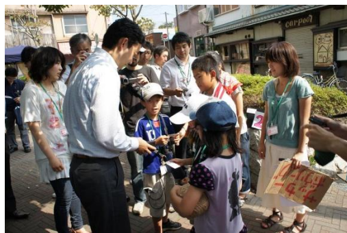
市長と名刺交換。子ども達も喜んでいました。