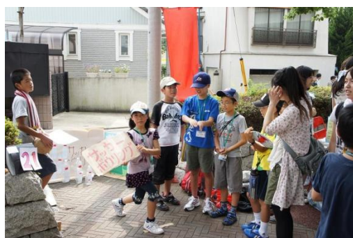
スポーツイベント会社は、サッカーボウリングで ストライクを出した人に割引券を提供しました。