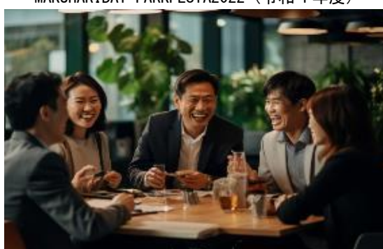
異業種交流会（イメージ図）