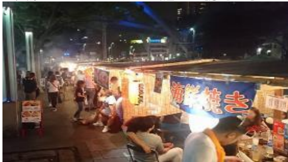
ちば富士見屋台横丁（令和元年度）