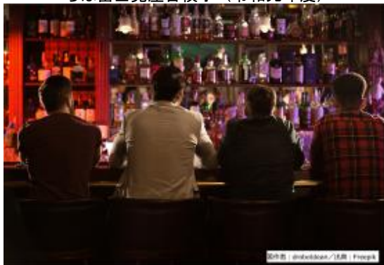
バー巡り（イメージ図）