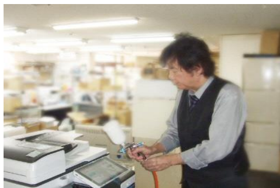
光触媒施工の様子

当社としてはブームにあやかるつもりはございませんので、一件ずつ丁寧に受注させて頂き、価格も施工技術に関心をよせて頂いたお客様には特別価格をご提示しております。