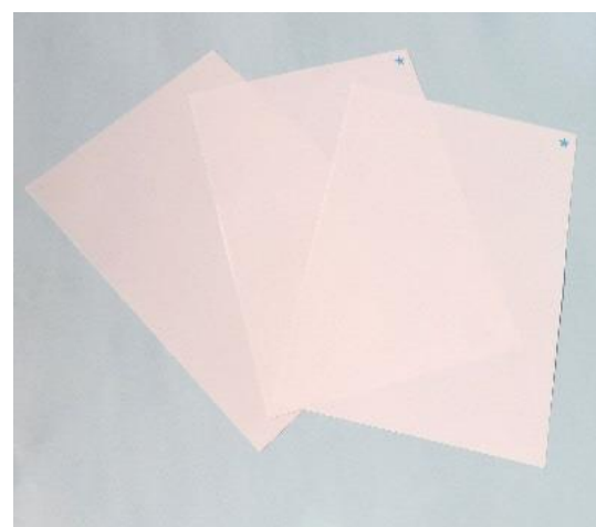
光触媒ウイルス除去シート