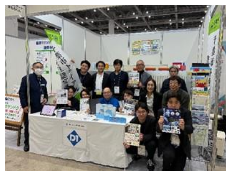
産業交流展の様子