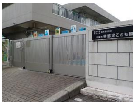
こども園に設置された認定製品

今後もHPやSNSでも「千葉市トライアル発注認定事業者」であることをPRし、他の自治体や民間の幼稚園・保育園様に営業を行っていきたいと考えています。