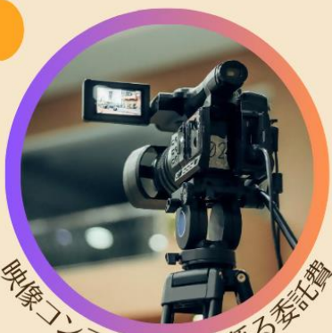
映像コンテンツ制作に係る委託費