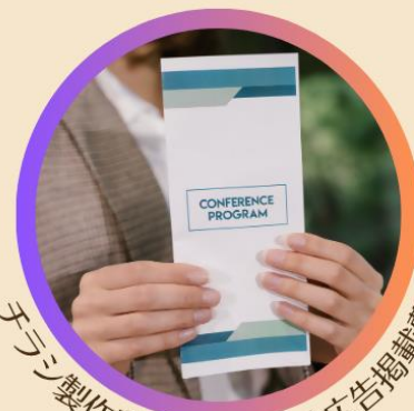
ランディングページ制作費、新聞・雑誌広告掲載費