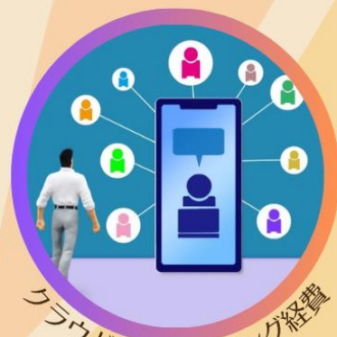
クラウドファンディング経費