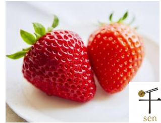
千葉市食のブランド「千」に認定されている「嬉しいイチゴ」(上)と「千葉快晴メロン」(下)