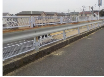
< 対策後 >

< 対策内容 > 既存ガードレールを活かした転落防止柵の 設置 [道路] < 対策時期 > 対策済み