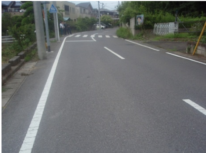
< 対策前 >