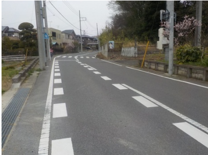
< 対策後 >