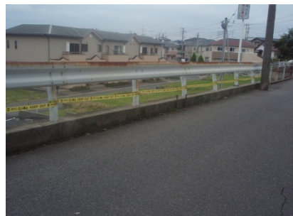
< 対策前 >