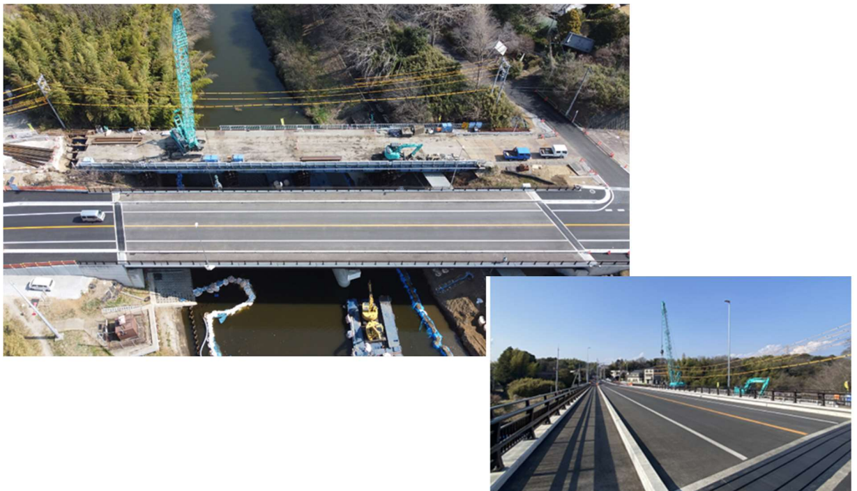
新橋完成(令和5年3月現在)

なお、引き続き護岸工事を行うことから、工事期間中の交通規制等によりご迷惑をおかけしますが、ご協力のほど、よろしくお願いいたします。