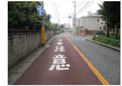
< 対策後 >

< 対策内容 > 路面標示「学童注意」設置 【道 路】 < 実施時期 > 対策済