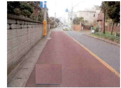
< 対策前 >

< 状 況 > 通学児童が横断するが、道路が カーブしており見通しが悪く、かつ 交通量が多いため危険。