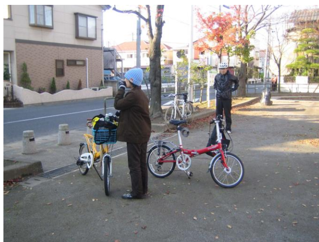
平成 22 年 11 月 27 日（土） ～公園で一休み～