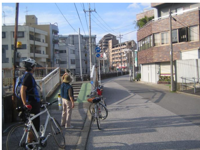
平成 22 年 10 月 16 日（土） ※前倒し調査