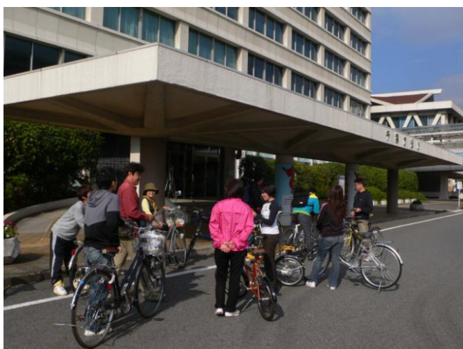
平成 22 年 11 月 6 日（土） ～調査開始前の打ち合わせ～ （市役所にて）