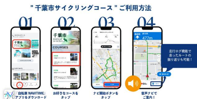
アプリ利用イメージ