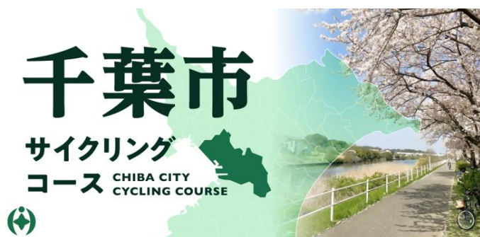
アプリ内バナーイメージ

サイクリングコース周辺の観光施設などを「立ち寄りスポット」として、各コースで5スポット程度紹介しています。