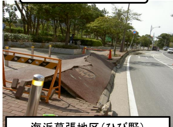
海浜幕張地区(ひび野)