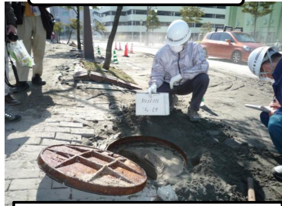
海浜幕張地区(ひび野)