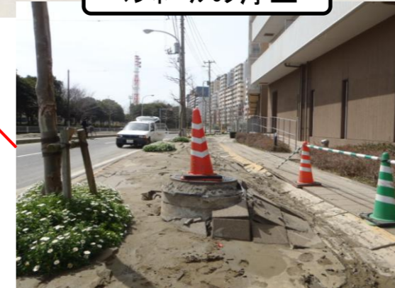
海浜幕張地区(打瀬)