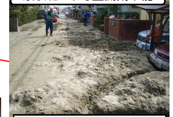
稲毛海浜地区(磯辺)