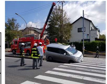
令和元年9月17日 緑区あすみが丘道路陥没事故