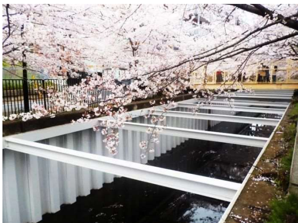
草野水のみち（稲毛区園生町付近）