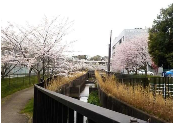
ろっぽう水のみち（若葉区殿台町付近）