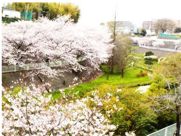
六方調整池（若葉区愛生町付近）