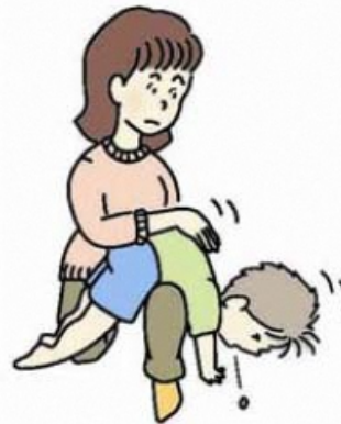
図 2 背部叩打法変法 (少し大きい子)