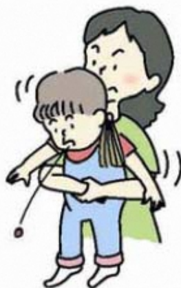
図 3 ハイムリッヒ法 (年長児)

大人や年長児では、後ろから両腕を回し、みぞおちの下で片方の手を握り拳にして、腹部を上方へ圧迫します (図 3)。この方法が行えない場合、横向きに寝かせて、または、座って前かがみにして背部叩打法を試みます。