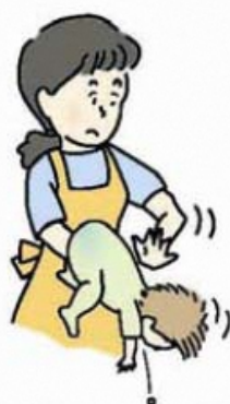
図 1 背部叩打法 (乳児)

乳幼児では、口の中に指を入れずに、乳児は片腕にうつ伏せに乗せ顔を支えて (図 1)、また、少し大きい子は立て膝で太ももがうつ伏せにした子のみぞおちを圧迫するようにして (図 2)、どちらも頭を低くして、背中の中を平手で何度も連続して叩きます。なお、腹部臓器を傷付けないよう力を加減します。