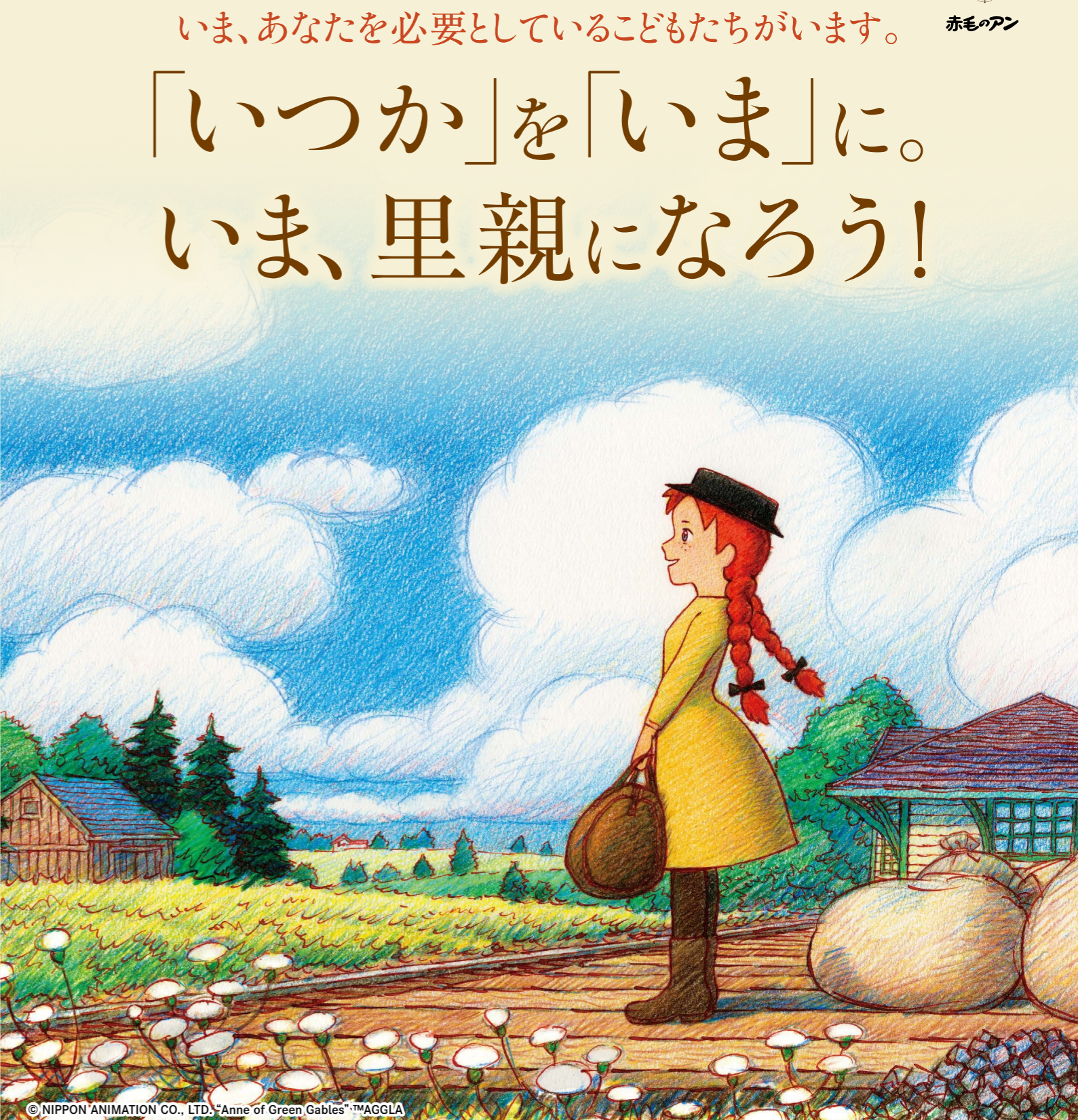
© NIPPON ANIMATION CO., LTD. "Anne of Green Gables"™AGGLA

あたたかな家庭を心から願ったアンは、マッシュウとマリラに出会い、二人の愛情に包まれながら、自分らしく豊かで幸せな人生を歩みます。 いま、日本には親と離れて暮らす子どもたちが、約4万2千人います。「里親制度」は、そうした子どもを自分の家庭に迎え入れ、必要な生活費や養育に関する相談など、さまざまなサポートを受けながら育てる制度です。 子どもの成長には、とによりで応援してくれる大人が必要です。子どもたちの力になれるのは、あなたです。