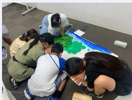
④作品をつくることや