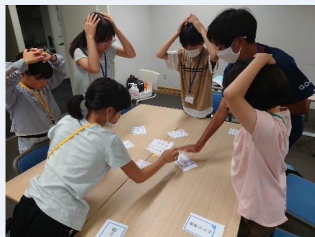
③たまには遊んだり

☆ワークショップのくわしい内容は、参加したみんな決めていきます。どんな活動になるかはみなさん次第です!