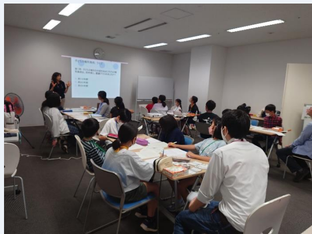
①みんなで勉強したり