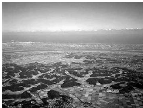
大友館跡航空写真

『千学集抜粹』では、忠常の本拠地を香取郡の大友としており、また、『今昔物語』に「内海に遙かに向かひに有る也。」とあり、内海を濠海とすると両者は符合する。