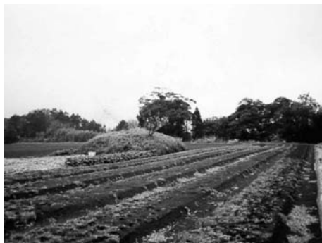
大友館跡 香取郡東庄町大友