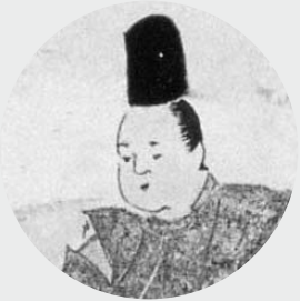
千葉介常重 『下総国千葉郷妙見寺大縁起絵巻』より 歎喜寺蔵 非公開

常重は、両総平氏に属する大椎常兼の嫡子。常兼の没後、千葉に移住し、新たに武士団(千葉氏)を形成する。