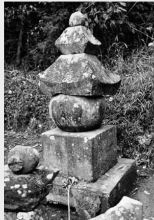
千葉介胤直の墓 多古町東禅寺