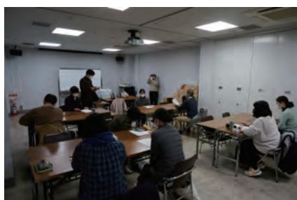
史料整理のようす

この日は、県内の文化財関係者、学校教員、学生、地域の方など、多彩な顔ぶれでの作業となりました。いまだ新型コロナウイルス感染症の影響から脱しきつ