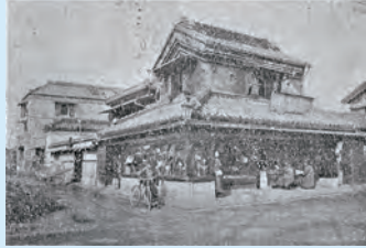
多田屋書店（いずれも『千葉街案内』より）