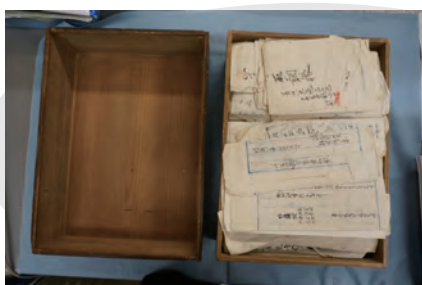
今回整理した史料群

今回整理対象となったのは、主に明治期の小中台村関係と思われる史料群です。この史料群は、2021年末、ネットオークションに出品されているのを千葉資料救済ネットが確認、購入をしたものです。現在は千葉市立郷土博物館に保管していますが、目録作成などの整理が未済であったため、今回千葉資料救済ネットの有志のみなさんが整理作業をしてくださいました。