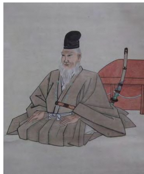
千葉常胤肖像画及び自詠短冊(部分) 成田山靈光館所蔵