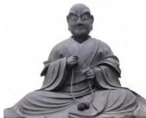
葛西清重坐像(複製) 葛飾区郷土と天文の博物館所蔵 [原資料超越山西光寺所蔵]