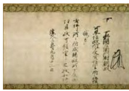
県指定文化財源頼朝袖判下文(複製) 小山市立博物館所蔵 [原資料神奈川県立歴史博物館所蔵]