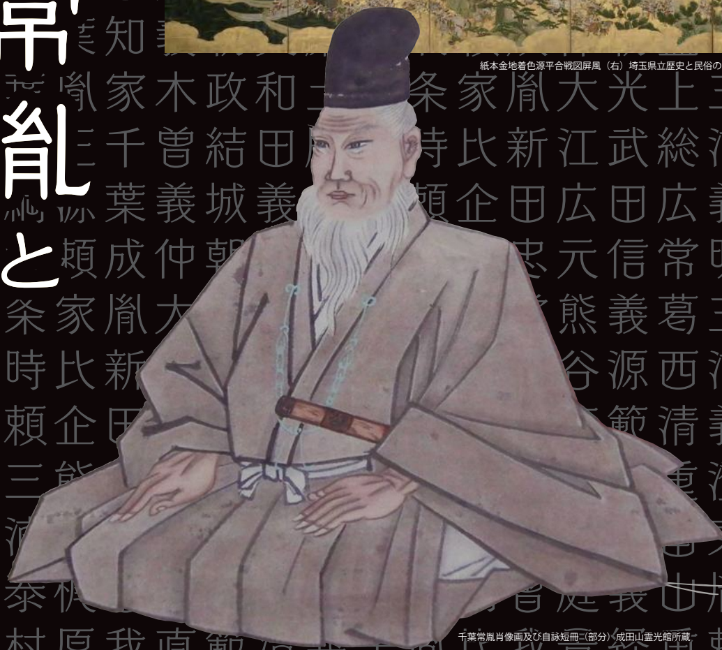
千葉常胤肖像画及び自詠短冊(部分) 成田山靈光館所蔵