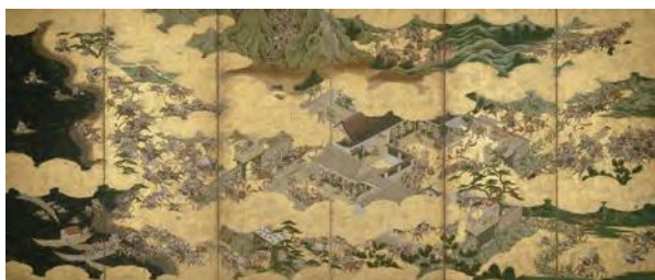
紙本金地着色源平合戦図屏風(右) 埼玉県立歴史と民俗の博物館所蔵