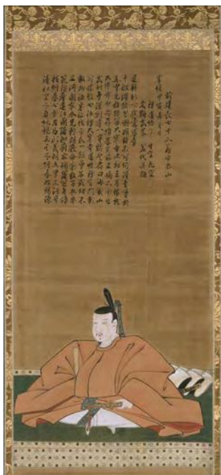
源頼朝像(複製) 鎌倉国宝館所蔵 [原資料海蔵山太學寺所蔵]

その後も、常胤は高齢にもかかわらず平氏や奥州藤原氏との戦いに活躍しました。その結果、千葉氏は、北は東北から南は九州にかけての広大な所領を獲得し、鎌倉幕府屈指の有力御家人に成長しました。このため、常胤はその後400年間続いた名族千葉氏の中興の祖と呼ばれています。本展では、平安時代末期から鎌倉時代初期の時期を中心として、鎌倉幕府の成立における常胤の働きや、常胤が仕えた源頼朝、そして常胤とともに頼朝を支えた北条時政、上総広常、畠山重忠などの東国武士たちの動向について、武器、木像、絵画等の資料を通じて紹介します。