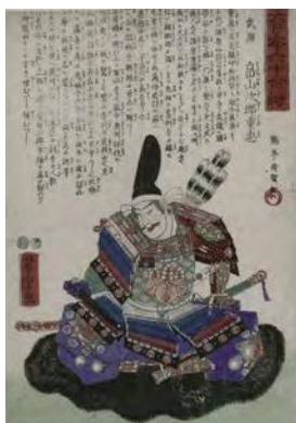
畠山次郎重忠大日本六十余将(錦絵)