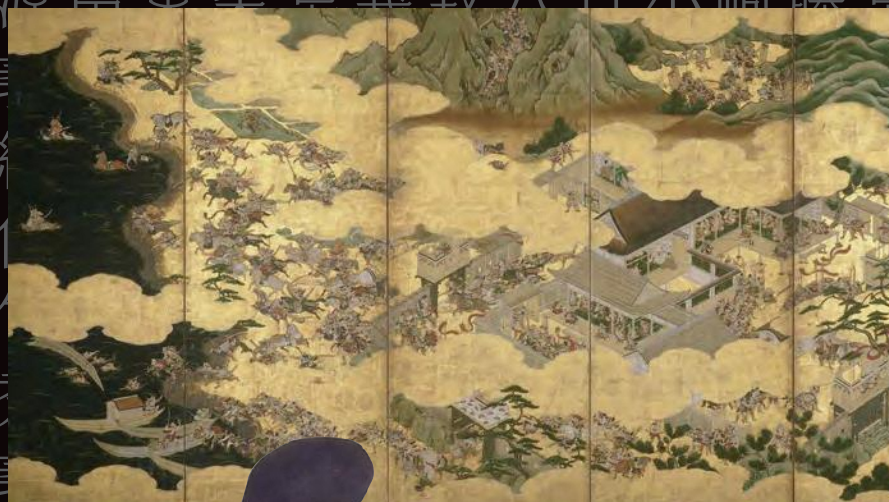
紙本金地着色源平合戦図屏風(右) 埼玉県立歴史と民俗の博物館所蔵