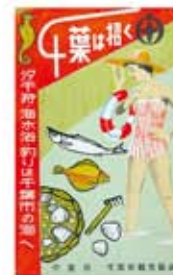
千葉は招く (昭和30年代)