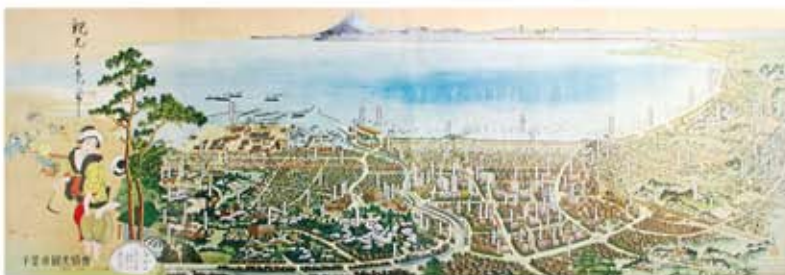
観光千葉市 (昭和28年頃)