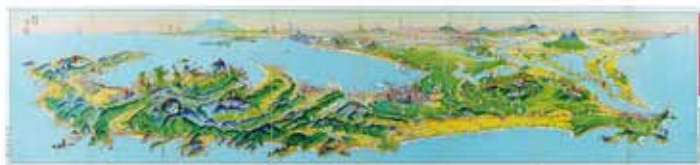
霊場の千葉県 吉田初三郎画 (昭和7年)