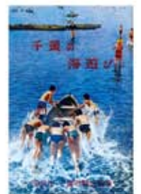
千葉の海遊び (昭和30年代)