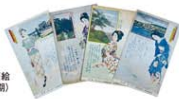
〔絵葉書〕名所美人図絵 (昭和初期)