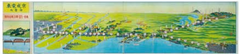
京成電車御案内 沿線名所図 (昭和4年)