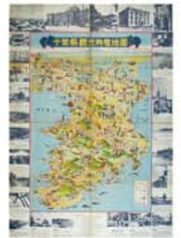
千葉県観光物産地図 (昭和27年)