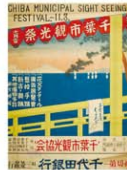
千葉市観光祭ポスター (昭和23年)