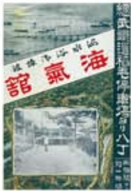
海水浴御旅館海気館 (明治42年)