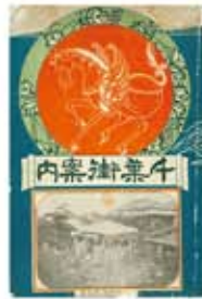
千葉街案内 古川国三郎編 (明治44年)