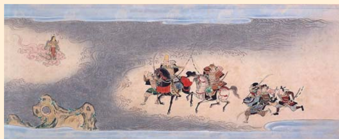
下総国千葉郷妙見寺大縁起絵巻(複製)