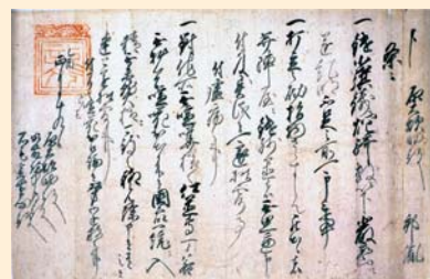
千葉邦胤朱印条書