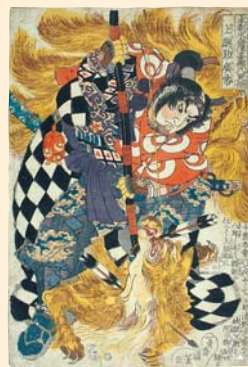
本朝水滸伝豪傑八百人一個上総助廣常