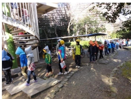
津波を想定した避難訓練（美浜区）