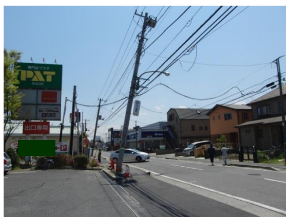
液状化により傾いた電柱（美浜区）