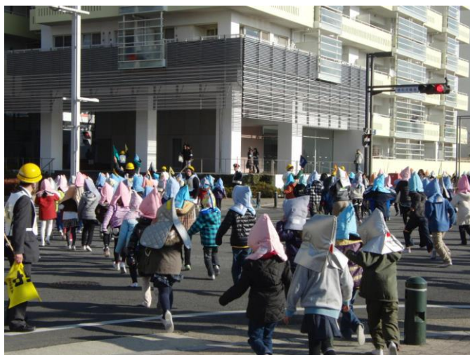
地域のマンションへの避難訓練