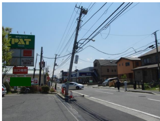
液状化により傾いた電柱（美浜区）