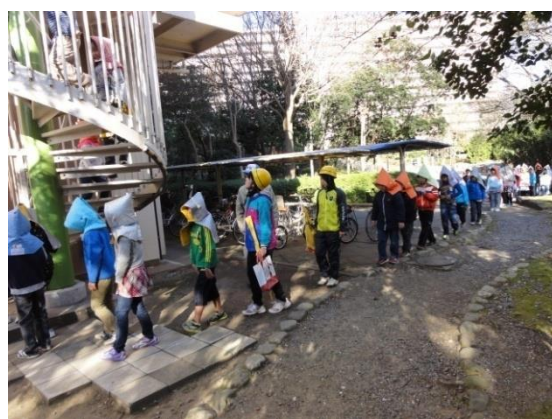
津波を想定した避難訓練（美浜区）