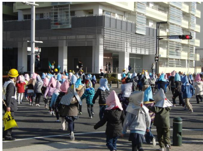
地域のマンションへの避難訓練