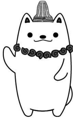
加曾利貝塚 PR 大使 かそりーぬ