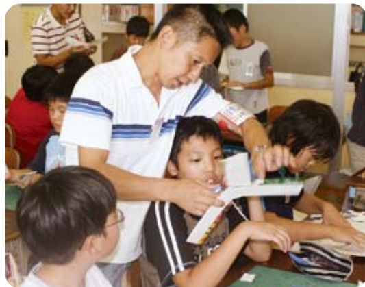
おやじの会の方とブーメランづくり

さらに、地域人材等を活用した学校支援など、地域ぐるみの教育を一層推進していきます。