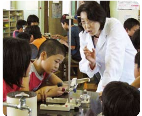
理科支援員による授業支援

また、科学館、図書館、博物館等を活用した学習の積極的な展開や、思考力・判断力・表現力などを一層高めるための授業づくりにより、子どもに好奇心と主体的な学びの力をはぐくむとともに、基礎的・基本的な知識・技能を活用して課題を解決する力を身に付けさせます。