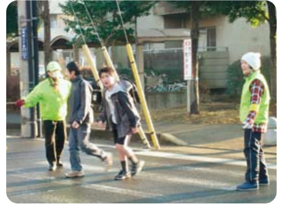
子どもの安全を見守るセーフティウォッチャー

また、学校教育のさらなる充実に向け、地域の教育的資源と力を取り込む仕組みづくりを進めるなど、学校・家庭・地域・行政が一体となって子どもの成長をサポートする体制を構築していきます。