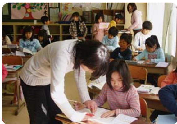
ティームティーチングで行う少人数指導