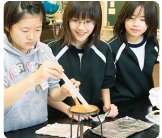
小学生の中学校体験学習

学校適正配置の推進や施設設備の整備などにより、子どもが、安全な環境のなかで安心して学べる教育環境を整えていきます。また、幼保小連携教育や小中一貫教育をはじめとする学校間・学校種間の連携による教育の充実など、学びや自立の基礎を確立するとともに、魅力ある学校づくりに向けた取り組みを推進していきます。