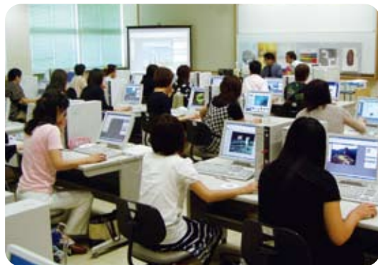
教職員のコンピュータ研修

また、子どもや保護者との相互の信頼関係の下に、よりよい教育が実現できるよう、教職員への支援に向けた体制整備を推進することにより、教職員が一人一人の子どもとじっくりと向き合えるような環境づくりを進めていきます。