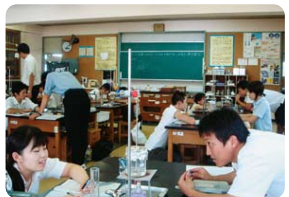
初任者研修(理科実験研修)