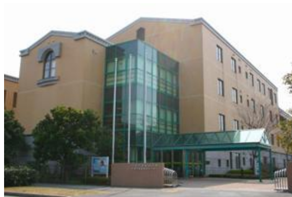
▲養護教育センター