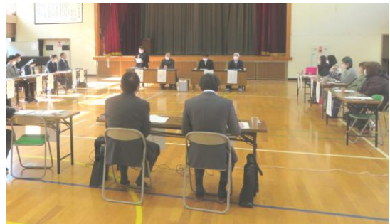
第4回統合準備会の様子

1月18日（水）に、統合前最後となる第4回「花見川第三小学校・花島小学校統合準備会」が花島小学校で開催されました。これまでの準備状況について、学校、保護者会・PTA、地域、教育委員会等から報告・協議を行いました。統合後の新しい「花島小学校」のスタートに向けて、準備が進んでいる状況を確認しました。