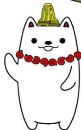
加曾利貝塚 PR大使 かそりーぬ

今回の取組で、1人1日 30分 早く帰ることができれば、1か月で約 10時間 、在校時間を削減することができます。