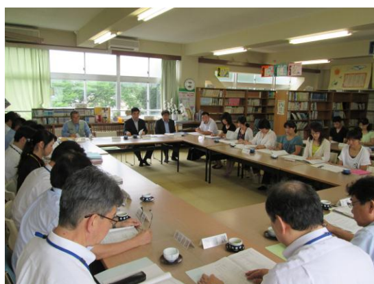
<花見川第一中・花見川第二中統合準備会委員>（敬称略）

統合に向けた準備を進める中で、具体的にはいろいろな問題点も有ると思いますが、円滑に準備が進行することを期待して、地域として支援していきます。青少年育成委員会の統合に向けても、9月に入ると、本格的なすり合わせの話し合いを進めていく予定であります。