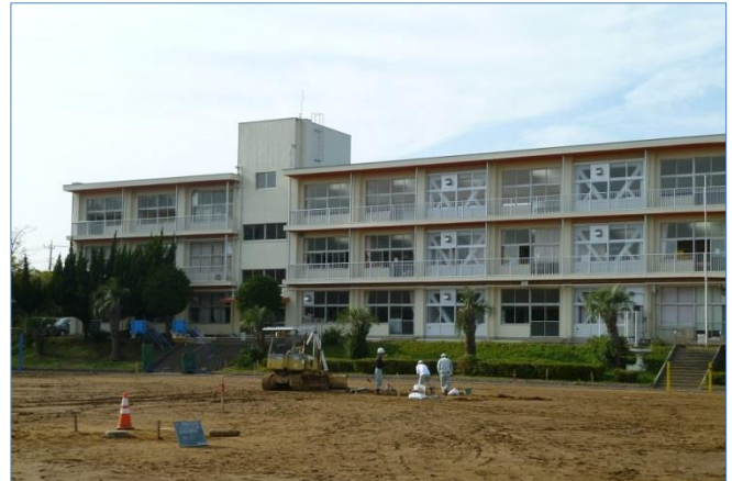
校舎の改修が完了し校庭の改修が進む第一小

これから、統合の準備を本格的に進めていきますが、子どもたちに夢を持ってもらえるような、楽しい学校となるように準備を進めていきたいと思っておりますので、ご協力をお願いします。