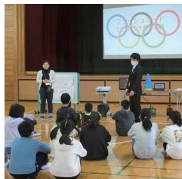
小学校国際教育の様子

問い合わせ 企画課 TEL 043-245-5908 / 教育指導課 TEL 043-245-5981