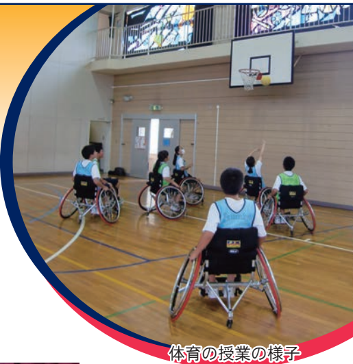
体育の授業の様子