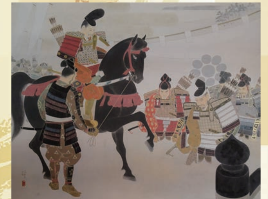
山谷瑛一作「君待橋」[当館蔵]

本パネル展は、御家人の筆頭となった常胤と、彼とともに幕府樹立に貢献した有力御家人13人の中から、「南関東編」として7人を紹介します。この機会に常胤の活躍した時代と千葉氏への理解を深めてみませんか。