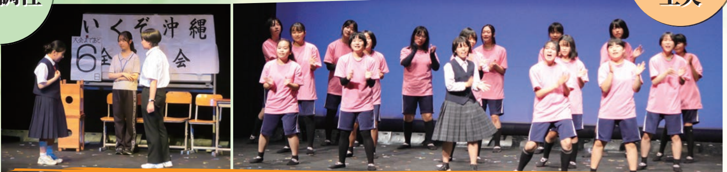
演劇部 / 幸町第二中・蘇我中