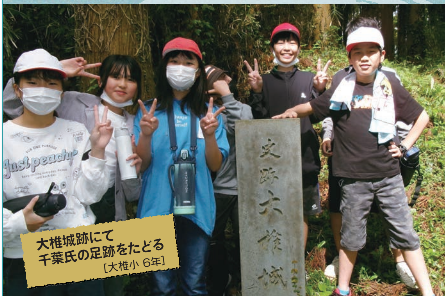
大椎城跡にて 千葉氏の足跡をたどる [大椎小 6年]