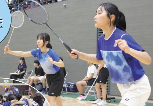
バドミントン部 / 葛城中