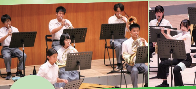
吹奏楽部 / 山王中・打瀬中