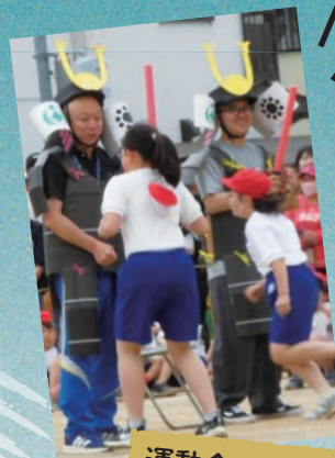
運動会 障害物競争における取り組み [院内小]