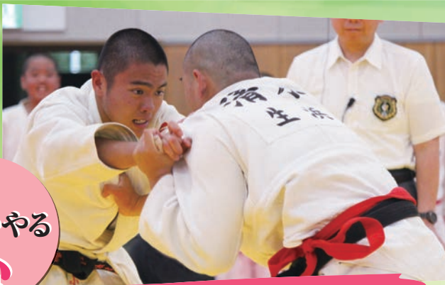
柔道部 / 幕張本郷中・生浜中