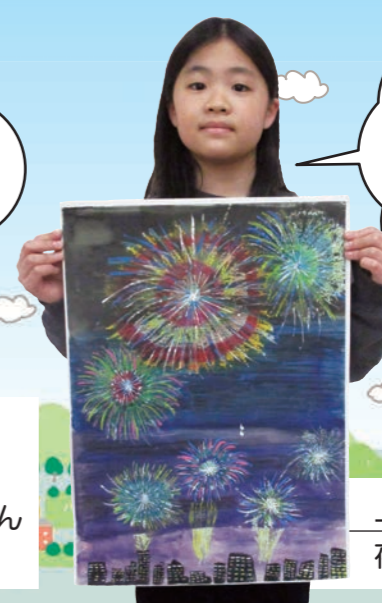
轟町小 2年 妙見大祭の「いけ!だらんだらん大太鼓」

夏祭りで行った公園の花火がきれいでした! 作品は、花火の大きさを変えて強弱をつけることを工夫しました。