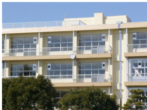
改修した花島小学校の校舎

自転車通学の承認は、学校長の判断です。市内にも、2km～4kmほどの通学距離がある地域について、一定の決まりのもと、承認している中学校があります。ただし、真砂地区において仮に中学校が統合しても、通学距離が2km以上になることはないと考えます。