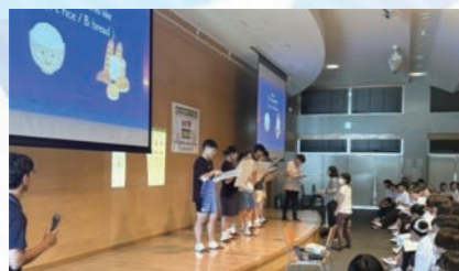
【韓国生徒との交流会】（日本にて）

令和5年度から8年度まで科学技術人材育成重点枠の研究指定を受け、※「世界へ羽ばたく科学技術人材の育成プログラムの開発」（World Scientists Challenge: WSC）を推進し、将来海外に進学・留学・就職し、世界で活躍する人材の育成を目指します。3年目である今年度は、選抜された本校1年次生、2年次生が、それぞれ韓国の蔚山科学高校、タイのチュラロンコン大学附属高校の生徒とリモート会議を活用して、科学分野に関する研究に1年間かけて取り組んでおり、相互に学校を訪問し合っています。