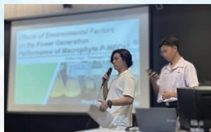
【タイ訪問時の様子】（タイにて）

SSH研究開発第Ⅳ期（基礎枠）の4年目となり、「分野融合型授業」・「課題研究」・「千葉市×SDGsの総合的な探究の時間」の充実、フィールドワークの開発及び普及、高大接続を視点とした連携体制の構築などを図っています。