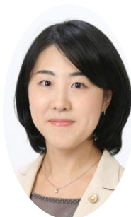
小西委員 教育長職務代理者