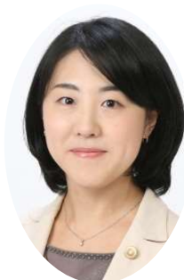
小西委員 教育長職務代理者