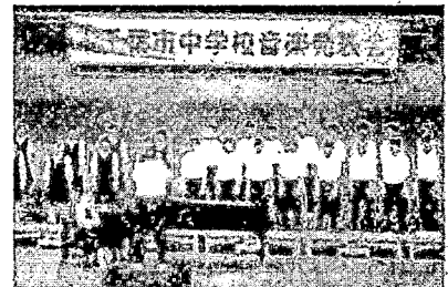
[心を一つにしたクラス合唱]