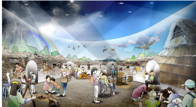
没入型展示「縄文体験空間」イメージ