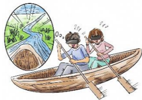
丸木舟を漕いで坂戸川を下る