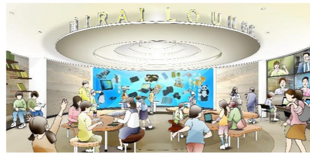
対話型展示「未来ラウンジ」空間イメージ