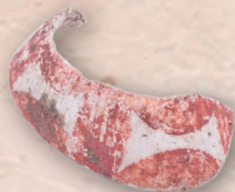
彩色貝製品 加曾利貝塚 (京都大学総合博物館所蔵)