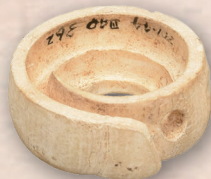
イモガイ製腰飾 有吉北貝塚 (千葉県教育委員会所蔵)

千葉市埋蔵文化財調査センター 〒260-0814 千葉市中央区南生実町1210番地 Tel.043-266-5433 maibun.fukyu@ccllf.jp