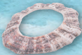
オオツノハ製貝輪 余山貝塚 (京都大学総合博物館所蔵)