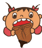
おかしあそび考古学者(ヤマミラ)

令和7年2月22日(土) 13:00～15:00 講師: おかしあそび考古学者ヤマミラ 事前申し込み 定員15名(申し込み多数の場合抽選) 参加費: 300円 ※食品アレルギーへの対応はしておりません