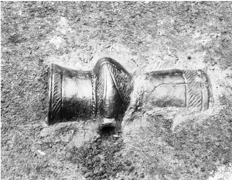
写真3 異形台付土器 出土状況 昭和48年