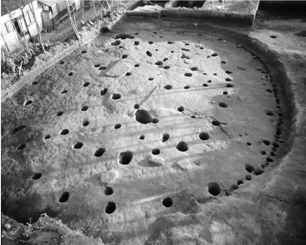
写真2 112号住居跡 遺物出土状況 昭和48年