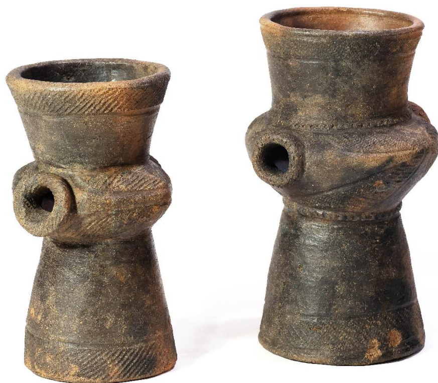
写真1 異形台付土器