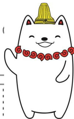
加曾利貝塚 PR 大使かそりーぬ

千葉市電子書籍サービスは、インターネットができる環境*1 さえあれば、いつでもどこにいても、お持ちのパソコンやスマートフォン、タブレット端末*2 などから電子書籍の検索・貸出・返却・閲覧ができるサービスです。アプリのダウンロードも不要です。