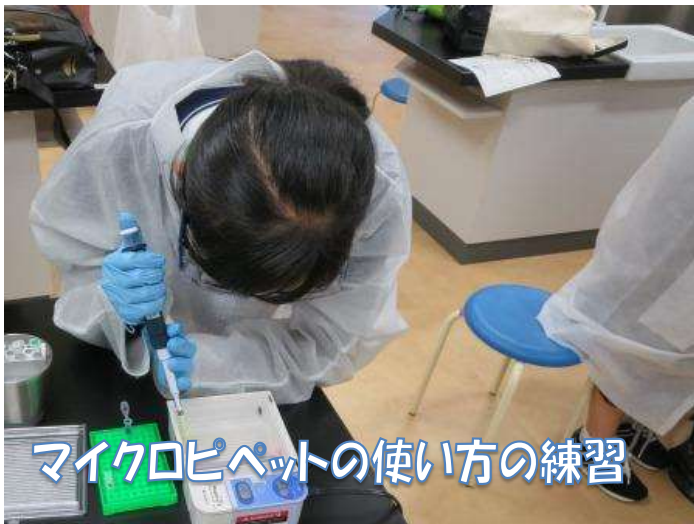
マイクロピペットの使い方の練習