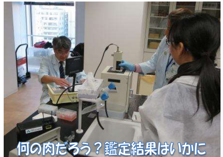
何の肉だろう？鑑定結果はいかに