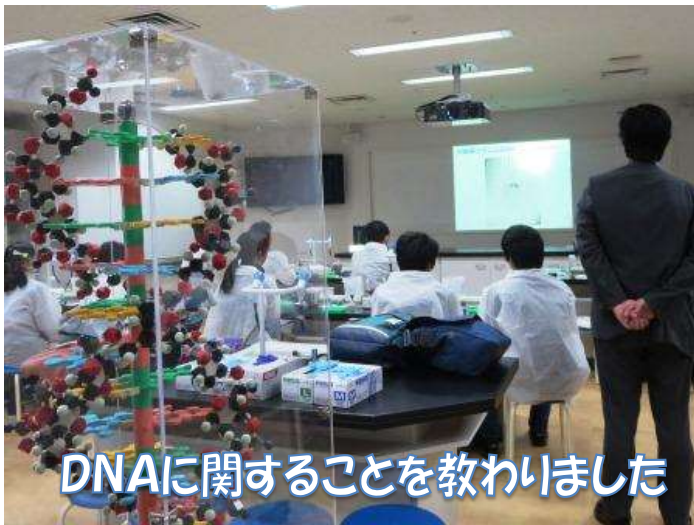
DNAに関することを教わりました