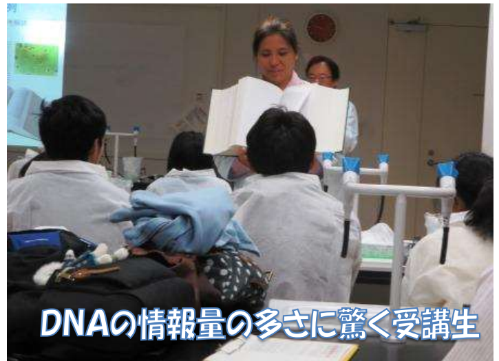
DNAの情報量の多さに驚く受講生