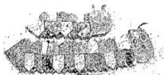
～はらぺこ青虫～ (完成品)